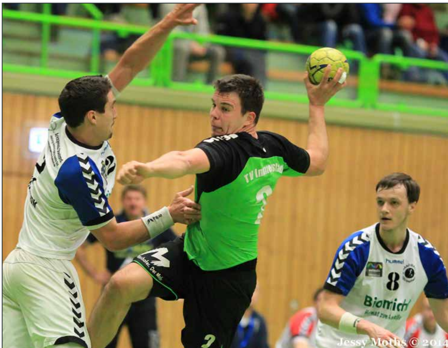
Jessy Moths © 2014